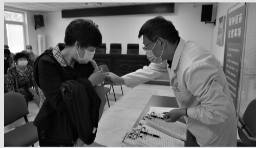
流动疫苗接种点内,居民进行接种。