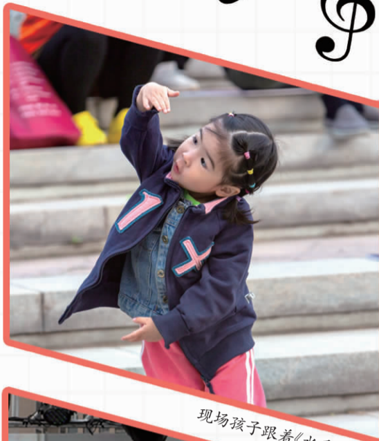
现场孩子跟着《水手》舞动