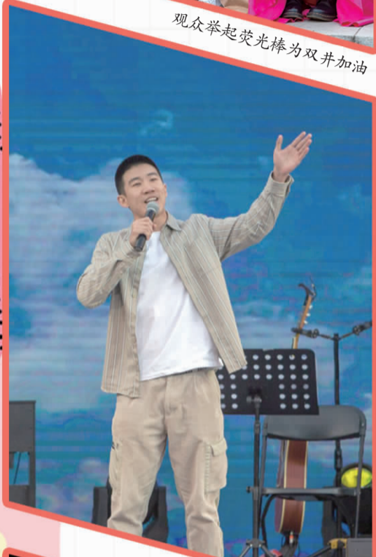
个人独唱《最美的太阳》