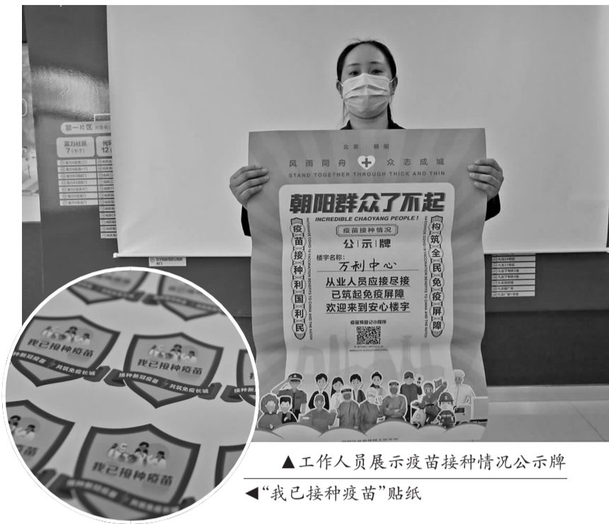
▲工作人员展示疫苗接种情况公示牌

同时,双井街道的楼长们及社区工作人员也发挥自身优势,利用中午时间走进商务楼宇开展宣传工作,通过张贴海报,实地调研等进行宣传。依托双楼长优势,调动楼宇及企业接种积极性,从而全面提高辖区企业对疫苗接种的知晓率。