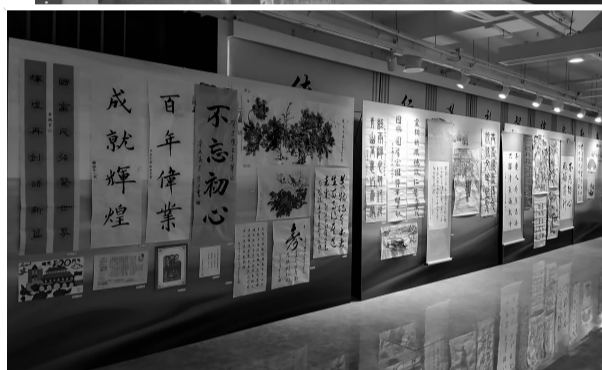
▲居民现场参观书画大赛获奖作品并拍照。