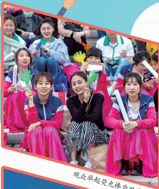
观众举起荧光棒为双井加油