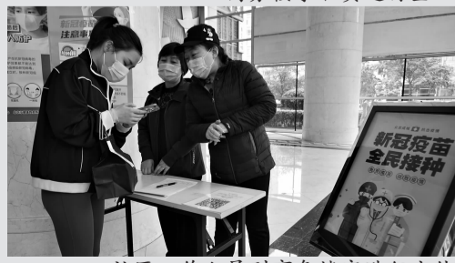
社区工作人员到商务楼宇进行宣传