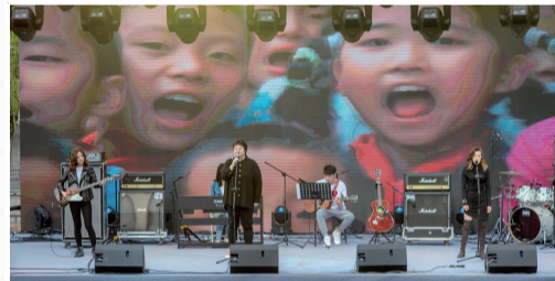
机关青年干部演唱《送你一朵小红花》

这支由青年一代组成的队伍将按照街道工委部署，围绕重点，服务大局，做到守土有责、守土有方、守土有效，参与地区建设，营造良好社会环境。