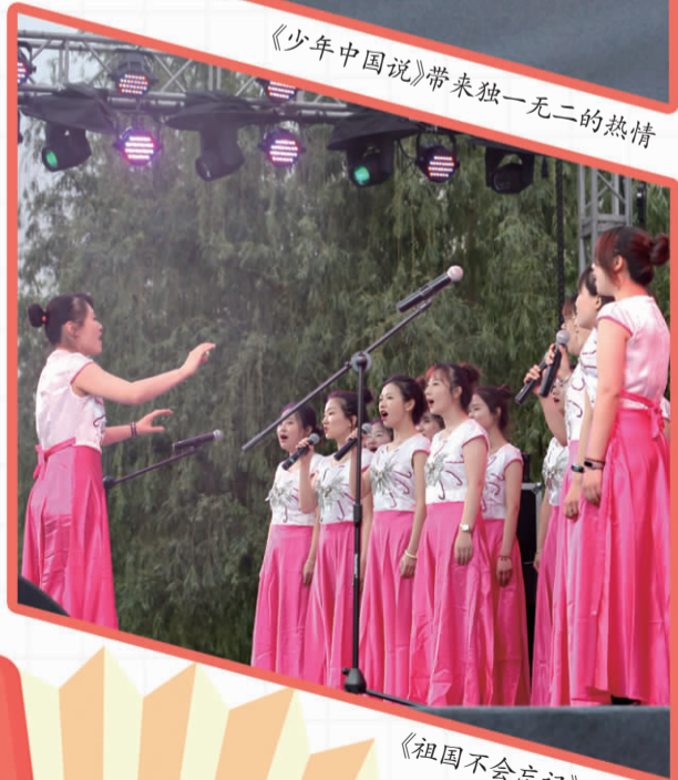
《少年中国说》带来独一无二的热情