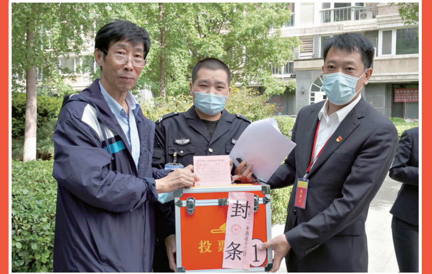
▲选举现场,选民投下庄重的一票。