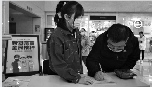
商务楼宇职员进行登记