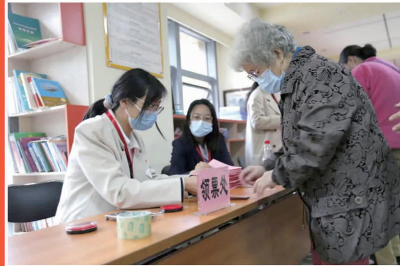
▲居民在领票处进行登记