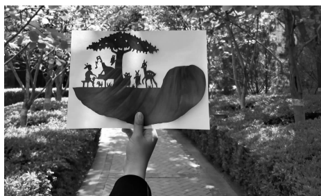
树叶画:森林音乐会